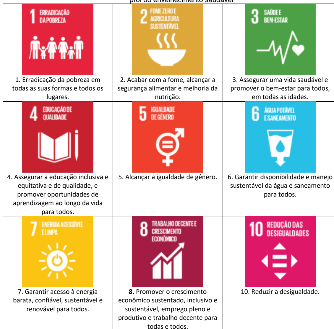
Tabela 5 – Objetivos do Desenvolvimento Sustentável alinhados à política em prol do envelhecimento saudável

As políticas públicas do município de Jacareí estão alinhadas aos 17 Objetivos do Desenvolvimento Sustentável. Considera-se que, as ações relacionadas aos requisitos de um programa que favoreça o envelhecimento saudável, permeiem 14 dos 17 objetivos previstos na Agenda 2030. Dentre eles podemos citar os objetivos listados pelo Instituto de Pesquisa Econômica Aplicada – IPEA, conforme tabela 5.