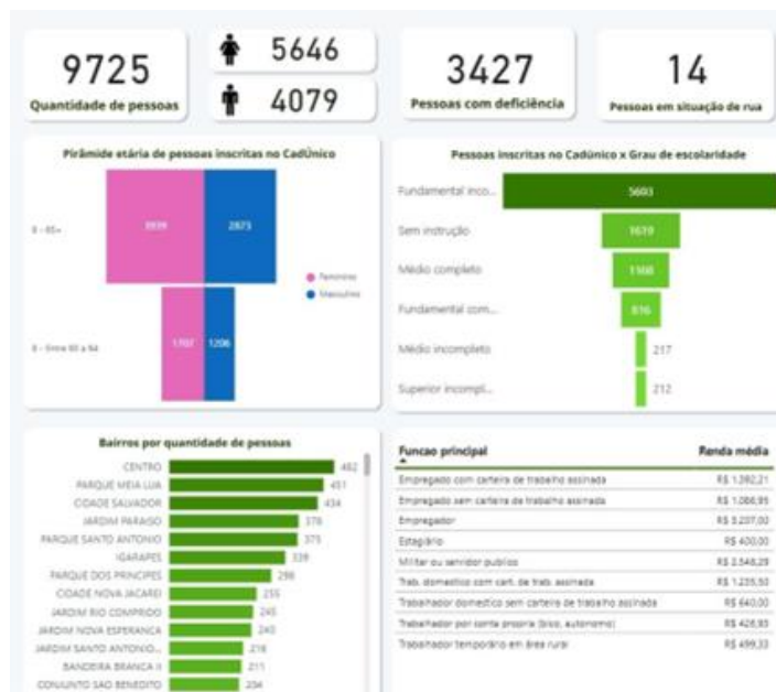
Gráfico 3 – Dashboard - População Idosa registrada no Cadastro Único (abril/2023)