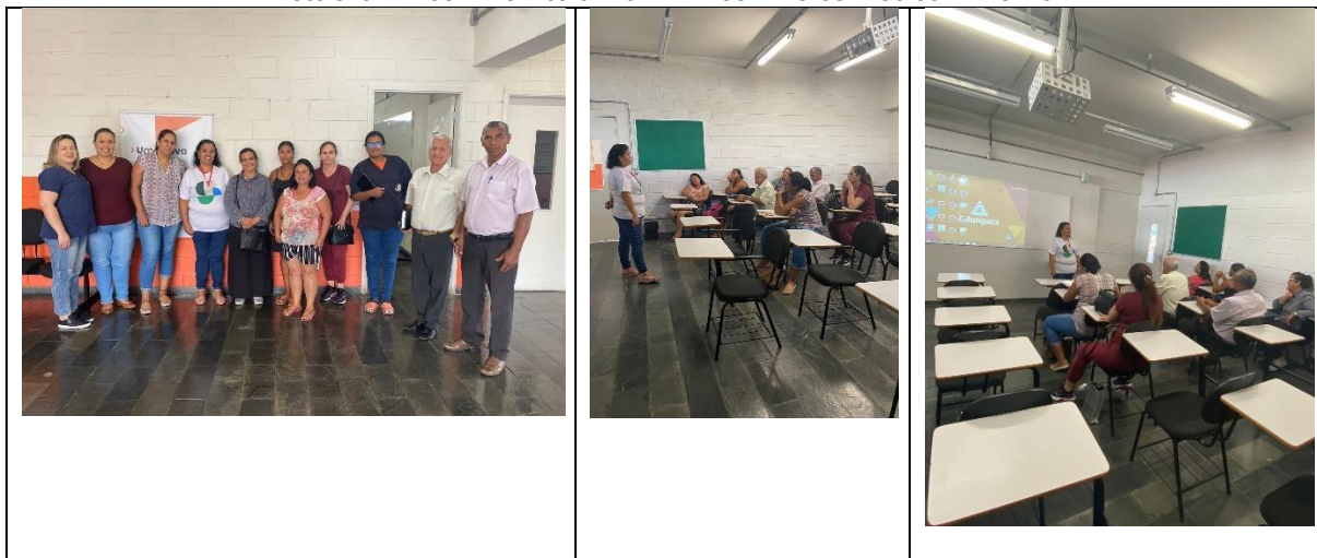
Foto 8: 6º. ENCONTRO – 09.04.2024 – ENCONTRO COM OS CUIDADORES