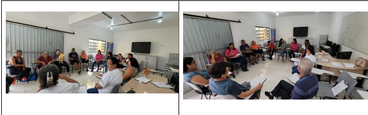
Foto 6: 4º. ENCONTRO – 13.03.2024 - REGIÃO LESTE – ONG ASSOCIAÇÃO FÊNIX