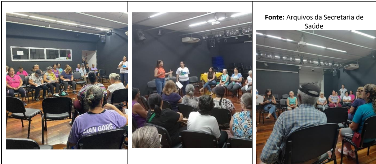
Foto 7: 5º. ENCONTRO – 20.03.2024 - REGIÃO NORTE – EDUCAMAI JACAREÍ – PARQUE MEIA LUA