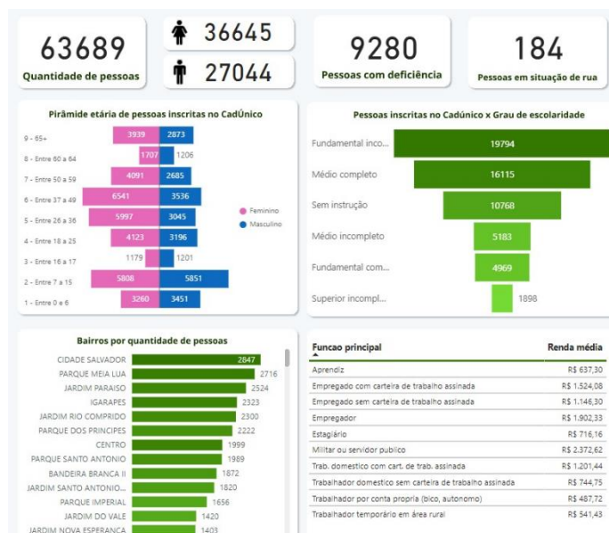
Gráfico 2 – Dashboard - População Geral registrada no Cadastro Único (abril/2023)