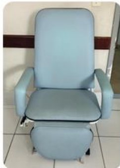
Adquiridas através de emenda impositiva, essas poltronas foram destinadas para o setor de Clínica Cirúrgica, comodidade, conforto dos nossos pacientes e acompanhantes. Os pacientes do pós-operatório necessitam de quarto com estrutura de acomodação para melhor recuperação pós-cirúrgica, pois a posição semi-fowler proporciona mais conforto respiratório das vias aéreas superior.