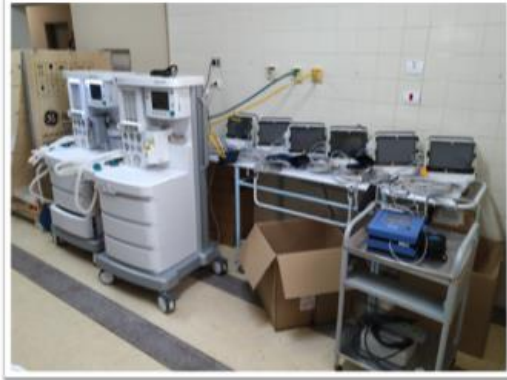
Adquiridos em 2021 para estruturação do Centro Cirúrgico, visando qualidade no atendimento prestado.